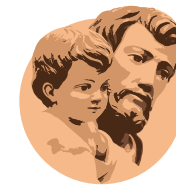
Illustration : Diego Rodríguez de Silva y Velázquez - Le marchand d'eau de Séville - détail - 1623 - Wellington Museum Apsley House, Londres